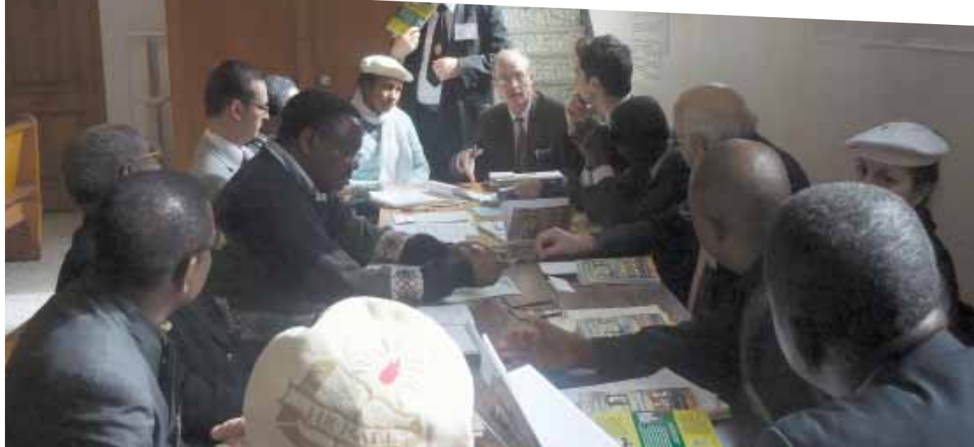
Odkrywali przyczynę problemu ubóstwa w Afryce i na całym świecie jak również jego rozwiązania