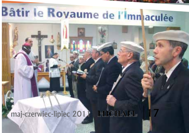
Bâtir le Royaume de l'Immaculée