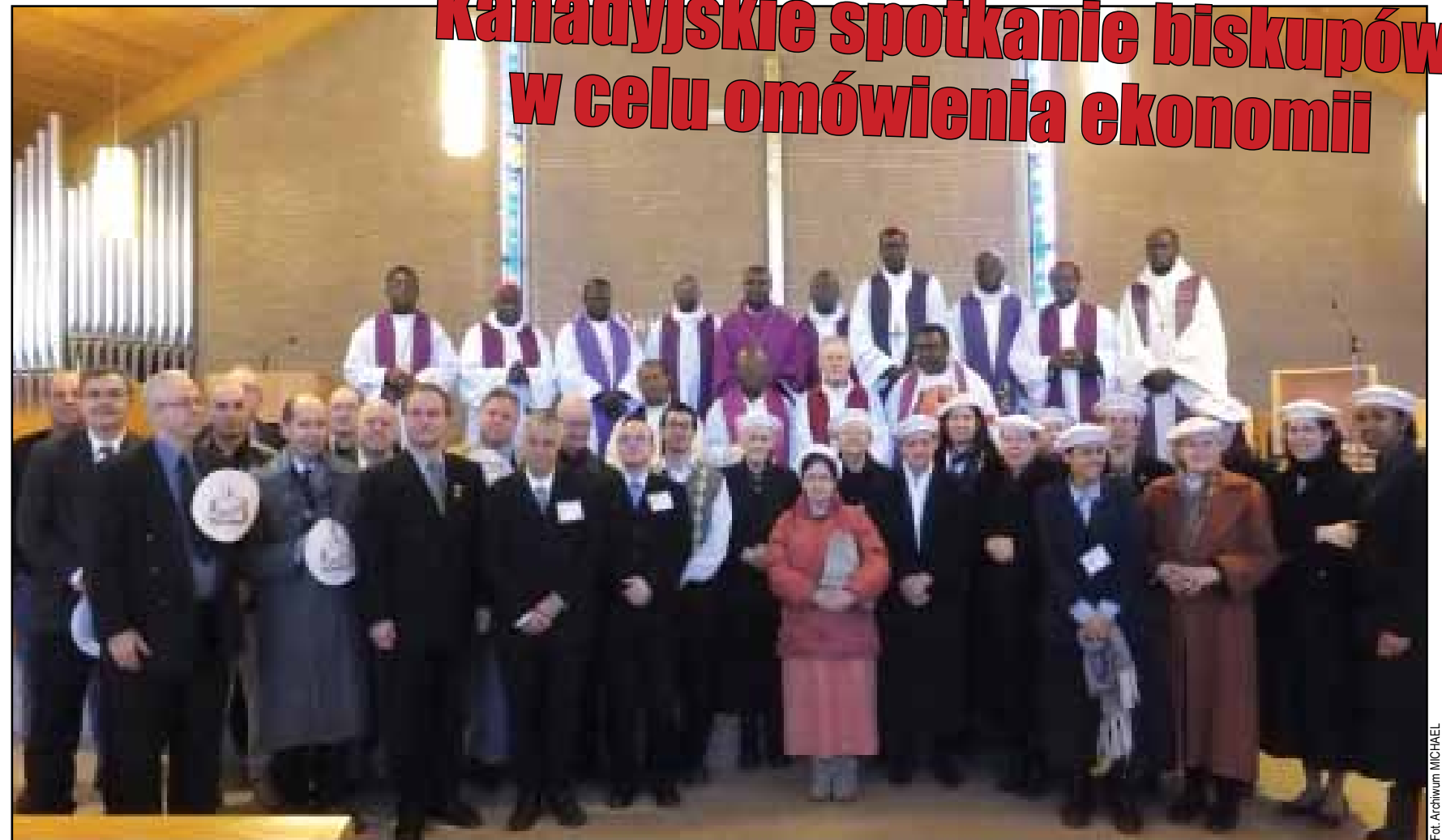
Uczestnicy sympozjum naukowego, Księża Biskupi, Księża, Pielgrzymi św. Michała i goście w kościele p.w. św. Cezarego po zakończonej Mszy św.

tygodnia naukowego. Musimy spowodować, aby poczuli oni niepokój sumienia! Musimy wspiąć się na górę, musimy dojść do tego punktu. Nie zostawiajcie ich w spokoju. Wiecie o naszej konferencji episkopatu, ufam, że nie pozwolimy, aby te sprawy pozostawiono i będziemy kontynuowali walkę, ponieważ, na ile to możliwe, jutro musi być lepsze; w znaczeniu tytułu waszej gazety VERS DE-MAIN (W kierunku jutra) [francuska edycja MICHAELA], jutro będzie lepsze. W to ufamy. Dziękuję Wam.