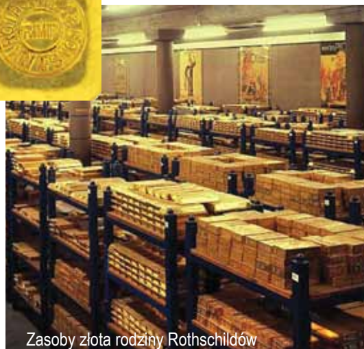
Zasoby złota rodziny Rothschildów