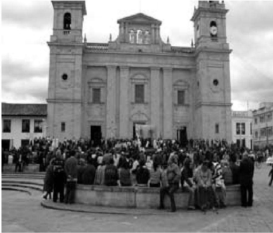
El domingo 13 de junio, los Peregrinos repartieron 7000 periódicos en la Catedral de Chiquinquirá, Colombia, en la fiesta de Corpus Cristi

En tiempos de la Colonia hasta el siglo XIX estos pueblos lucharon siempre por su libertad corporal, social y cultural. Ahora la lucha es más que nunca espiritual, totalmente espiritual y estamos concientes que no hay hombre alguno que la pueda librar, más que el mismo Dios que se hizo hombre y hace dos mil años se encarnó de María la Virgen. Trataré en el siguiente espacio de sobresaltar los hechos más importantes de esta misión.