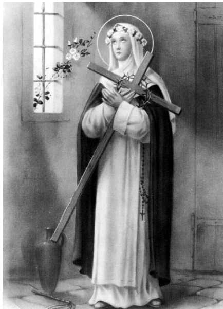
Santa Rosa de Lima