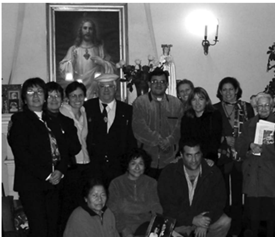
Al finalizar una de las primeras reuniones en Lima, Perú

Para las comidas cada familia traerá sus propios alimentos. Existen restaurantes cercanos a la fundación. Todos los asistentes al congreso tendrán alojamiento sin ningún costo en nuestras casas o en el monasterio.