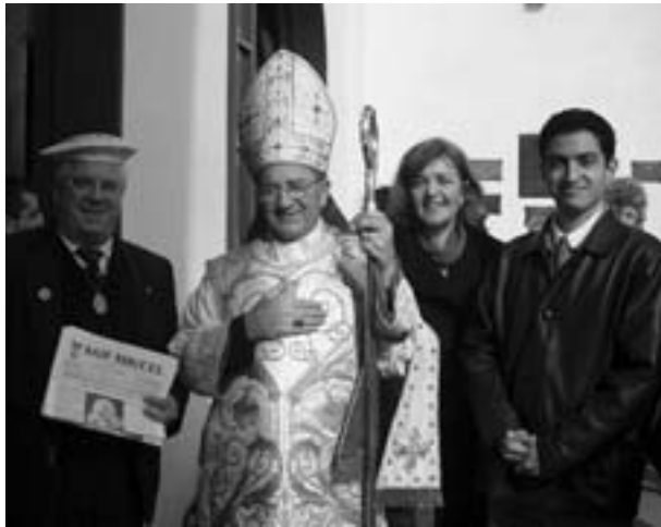
Saliendo de Misa en Buenos Aires, junto al Obispo Castrense, Basioto, de Argentina

Concordia, donde encontramos en la parroquia de Nuestra Señora de Fátima al mencionado sacerdote y tuvimos también con él y varios parroquianos un muy interesante encuentro.