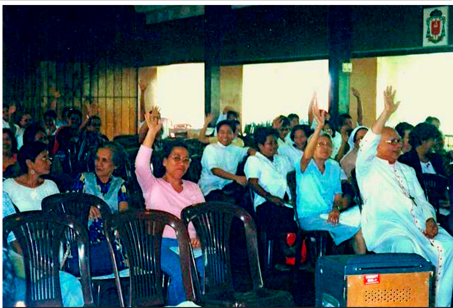
FORMACIÓN DEL "BANCO DEL AMOR" EN LA DIÓCESIS DE DAET, FILIPINAS. S.E.REV. MONS. ALMONEDA

Las personas de la región de Anjozoro en Madagascar, formaron una "Asociación del Rosario y